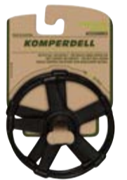
VARIO TIEF-SCHNEETELLER art. # 908-925