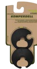
RACE TELLER EXTRA KLEIN art. # 379-925