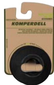
EISFLANKEN-SOMMERTELLER art. # 397-925