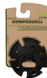
VARIO WINTERTELLER art. # 364-925