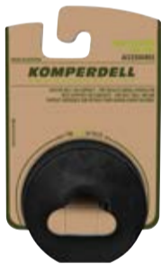
VARIO SOMMERTELLER art. # 356-925