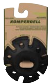
VARIO WINTERTELLER EXTRA GROSS art. # 912-925