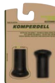
SPITZENSCHONER Ø 8 mm: art. # 192-925 Ø 12 mm: art. # 190-925