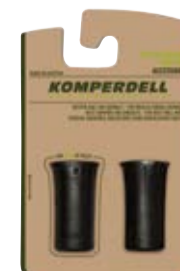
SPITZENSCHUTZ Ø 8 mm: art. # 162-925 Ø 12 mm: art. # 161-925