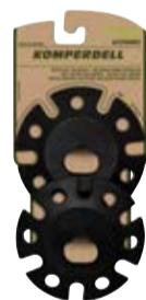
WINTERTELLER EXTRA GROSS art. # 354-925