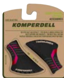
NORDIC WALKING PAD IN VERSCHIEDENEN FARBVARIATIONEN ERHÄLTlich