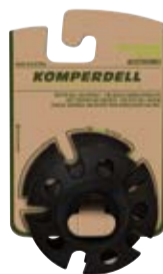
EISFLANKEN WINTERTELLER Wintersteller: art. # 396-925 Wintersteller extra groß: art. # 385-925