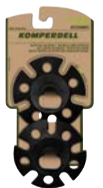
WINTERTELLER art. # 351-925