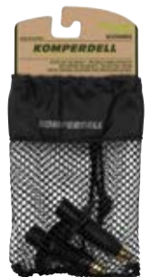
TRAIL SPITZE art. # 1016-925