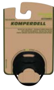
MINI UL TELLER art. # 943-925