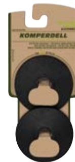
RACE TELLER art. # 352-925